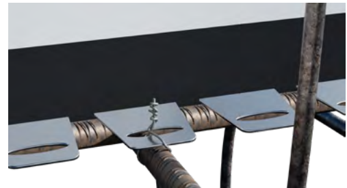
Schnelles & einfaches Anrödeln an der Bewehrung